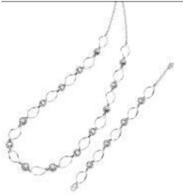
4. “感恩”铂金戒指 中国 冠华首饰