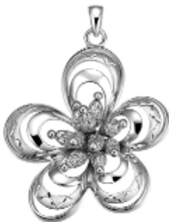
6. “花雨”铂金吊坠 中国 明牌珠宝